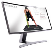
BTS Podium - Erőmérő pódium