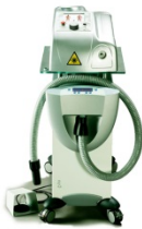
Mectronic Chelt Therapy - Krio- és HIL lézerterápiás eszköz