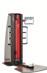
Globus Kineo- squat & pulley