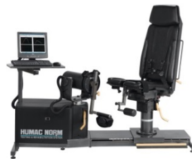
CSMI Humac Norm