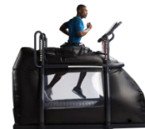
AlterG- Anti-gravitációs futópád