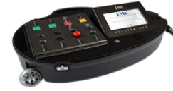
EME Polyter Evo- Multifunkcionális és hordozható fizoterápiás készülék