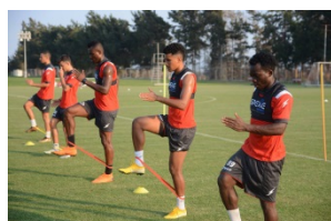
Gpexe teljesítmény monitoring rendszer