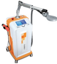
Optimus Pro – SIS lökéshullámterápiás készülék